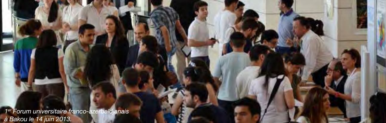
1 er Forum universitaire franco-azerbaïdjanais à Bakou le 14 juin 2013.